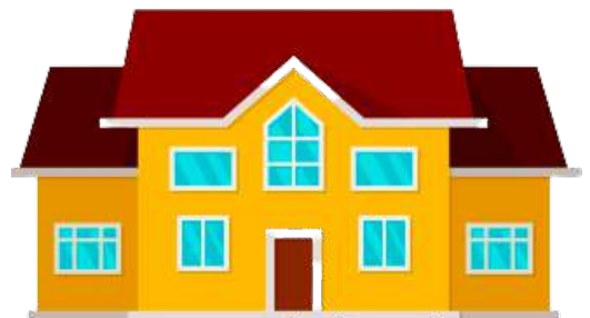
et stort hus