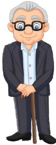
en gammel mand