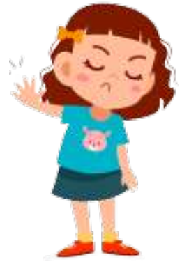
en sur pige