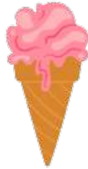
en kold is