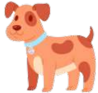
en sød hund