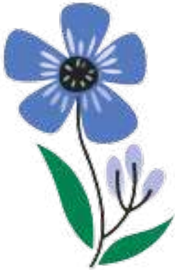
en smuk blomst