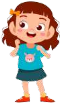
en glad pige