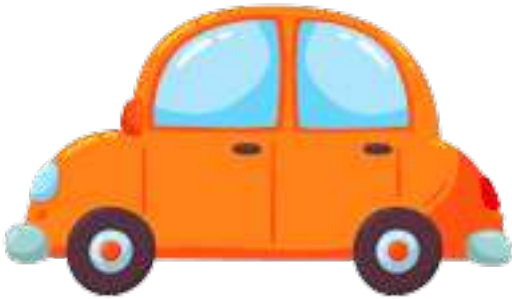
en orange bil