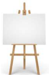
canvas and easel